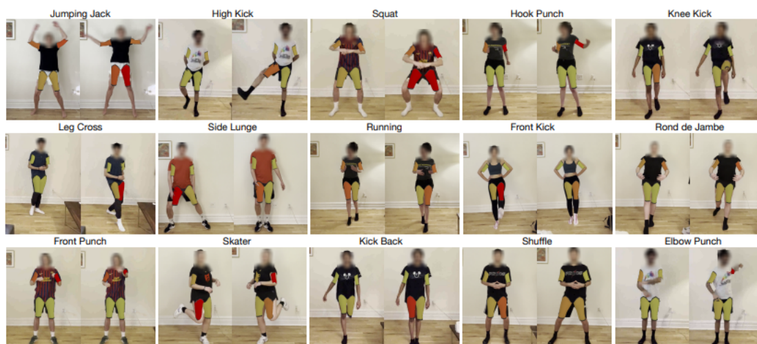
그림 2. Muscles in Action 데이터셋의 15가지 동작 예시 Fig. 2. Visual Examples of 15 Actions from the Muscles in Action dataset