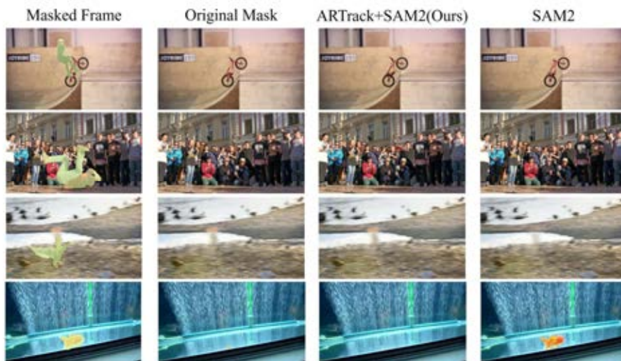
그림 2. DAVIS, Youtube-VOS 데이터셋 중 객체의 움직임이 빠른 비디오에 대한 결과 Fig. 2. Qualitative results for videos with fast moving objects among DAVIS and Youtube-VOS datasets