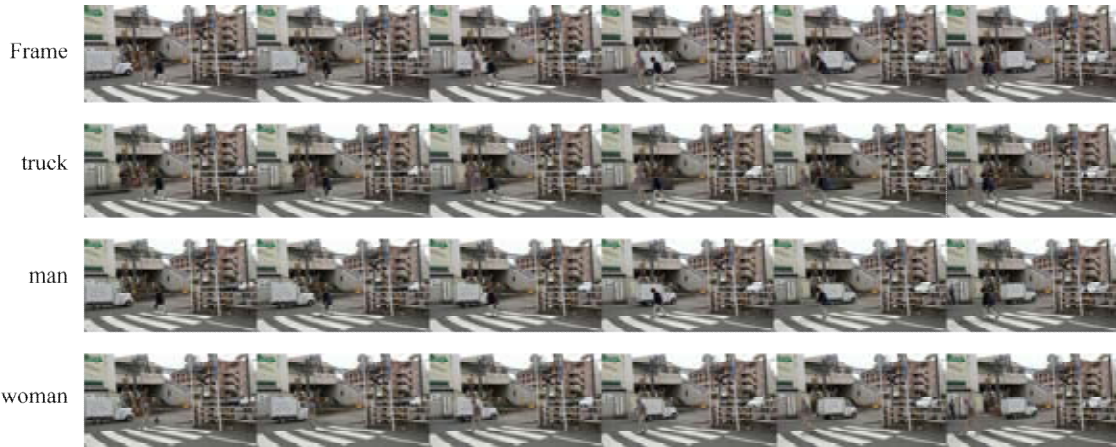
그림 3. 여러 객체가 등장하는 비디오에서 서로 다른 객체를 지정해 인페인팅 한 결과 Fig 3. Result of inpainting by specifying different objects in a video containing multiple objects